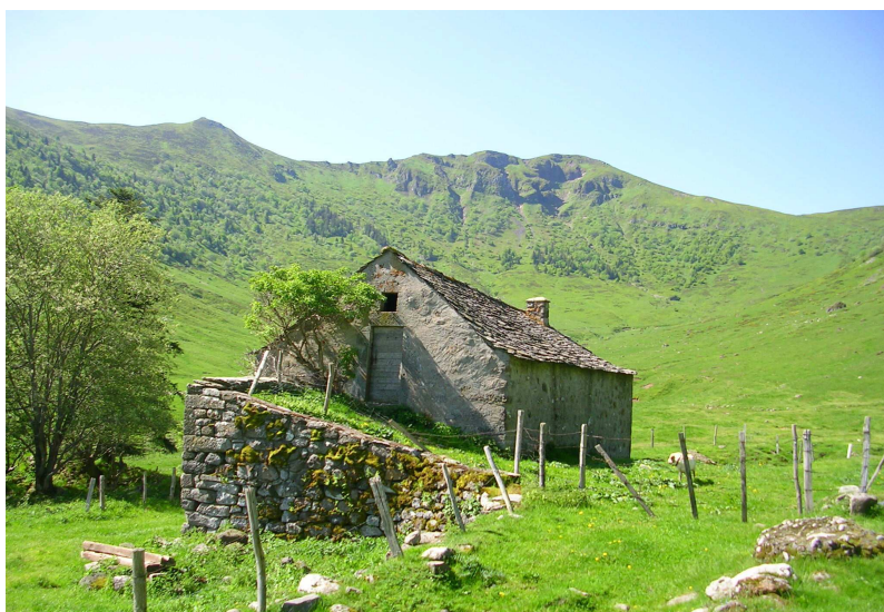
Le buron du Col de Cabre, avec en arrière-plan et de gauche à droite, le Téton de Vénus, le Puy Bataillouse et le col de Cabre

dernière fois la Santoire et devient plus raide (nombreux chamois à droite et à gauche) et rejoins finalement le col de Cabre (1528m, 1h30')