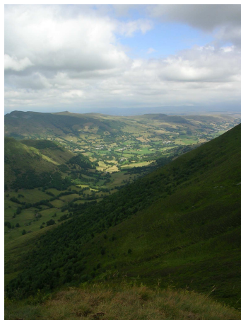
La vallée de la Santoire depuis le Téton de Vénus

Du sommet, continuer le PR sur 300m jusqu'au moment où il se rapproche des barbelés, puis prendre pleine pente à gauche dans les myrtilliés et la bruyère pour descendre tout droit vers la Gravière en passant au départ entre deux barres rocheuses. A la Gravière 5h45', remonter par la route jusqu'à la Boudio. 6h00'