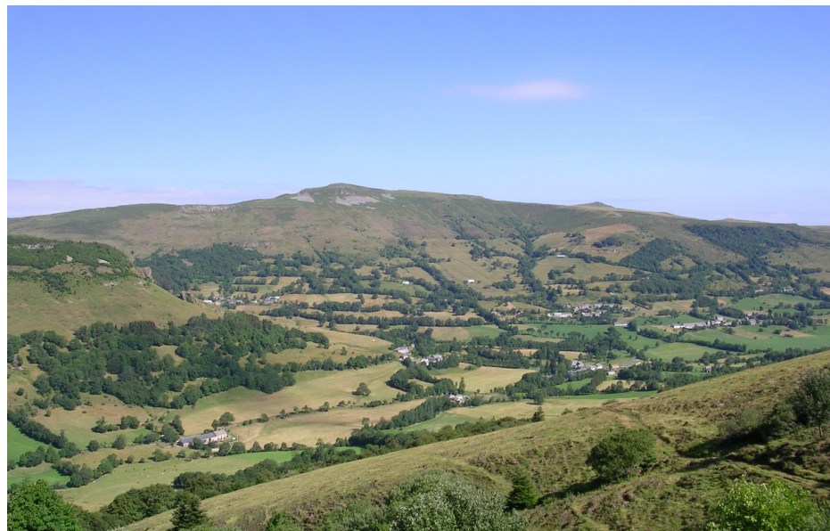
Panorama de Lavigerie depuis le Puy de Seycheuse. En bas à gauche, la Boudio.

la traverse pour continuer par la rue qui fait face partant à droite. Presque immédiatement, prendre la rue à gauche qui traverse le hameau de Lavigerie (marques bleues). Dans le haut du petit village, le chemin s'oriente vers la gauche à flanc de montagne pour rejoindre le hameau de la Gandilhon. Il emprunte pour quelques