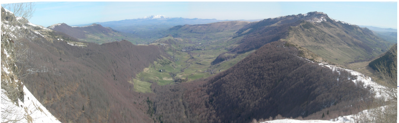
Séparant les vallées du Claux à gauche et d'Impradine à droite, le Puy de Niermont. Au loin, le Puy de Sancy

A ce sentier, vous prenez le sentier des Quirous vers la droite, en continuant sur le GR4, jusqu'à la Croix du Gendarme, que vous laissez sur votre gauche.